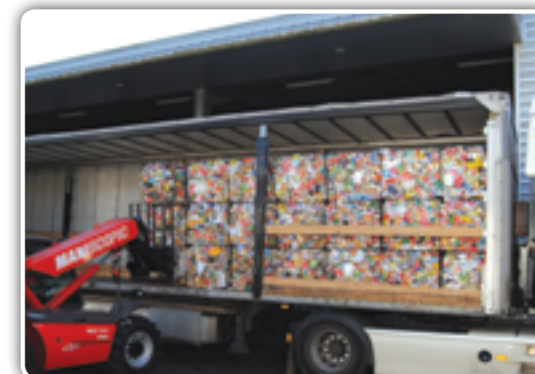
En 2011, 49 balles d'aluminium ont été enlevées pour être recyclées.

Une amélioration quantitative permet d'augmenter les recettes (les seules pour un Syndicat de traitement des déchets) et de réduire les quantités de déchets enfouis. Elles ne cessent en effet de progresser, mais nous ne recyclons encore que 21 % de notre poubelle alors que nous pourrions en recycler plus de 30 %.